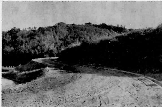
着々と進む山手線道路改良工事