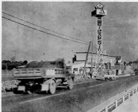
本年5月に操業開始した九州神鋼サービスセンター

別府地内に建設、敷地面積一五、七三二平方メートル、建設機械部品販売、昭和四四年五月操業開始