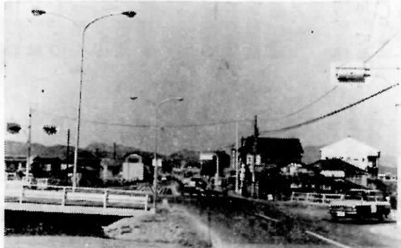
昭和43年4月25日設立された信号機(遠賀青果市場前三叉路)