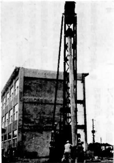
杭打機のひびきも高らかに