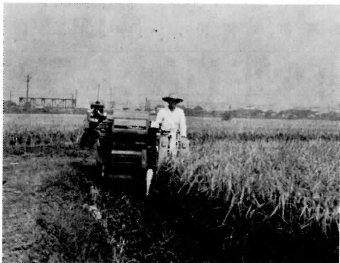
コンバインで稲の収穫作業（町内木守にて）

ダダダ……エンジン音が大地にひびき、黄金の稲田はみるみるみちにコンバインによって刈り取られてゆく。いよいよ秋の穫り入れが始まったのだ。