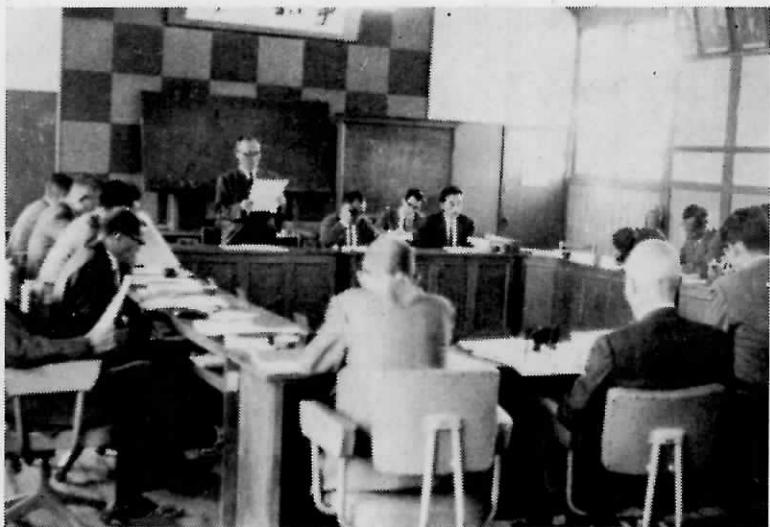
5月11日地方選挙後初の臨時議会が招集された