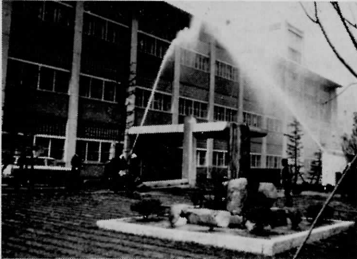
(本番さながらの島門校総合避難防火訓練)

当日は、午後2時「給食室から出火」を想定のもとに発煙筒をたき、校内非常ベルが鳴りびびく中を全児童は先生の誘導で迅速かつ 整然と運動場に避難を行ない、この間わずか約2分、一方消防団員は役場のサイレンを合図に、本部の消防車をはじめ、島門校区の各消防団員、浅木校区の分団長以上の団員約七〇名が3分後には現場にかけつけ、本番さながらの防火訓練を展開しました。 なお、当日は、水巻町消防署の署長以下幹部数名も技術指導のため参加を願い、訓練後校内の消火設備、避難方法等について詳細な指導をうけ、今後の不時の火災に備え有意義な訓練を実施することができました。