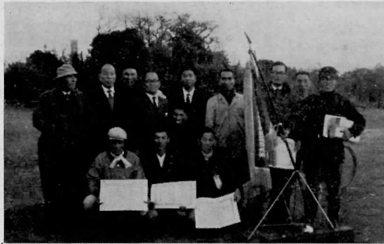
もみすり競技会で優勝旗を手に よろこびの遠賀町

昭和三十九年度遠賀町農民祭は去る十二月六日(日)遠賀中学校において盛大に行われた。同日は午前中天候も悪く、主催者側としては一時は心配しましたが、午後からは天気も回復し予定通り行事を進行することができた。又町民各位には、悪天候にもかかわらず早朝から多数参加、協力頂き無事農民祭の幕を閉じる事ができましたことを厚くお礼申し上げます。 特に本年は、北九州もみすり組合連合会主催(八幡農林事務所、西日本新聞社後援)による、第一回北九州地区もみすり競技会が同時に開催され、北九州市各区、中間市、遠賀郡内各町から多数の参加があり、遠賀町農民祭に錦上添花を添え近年稀に見る盛況の中に終