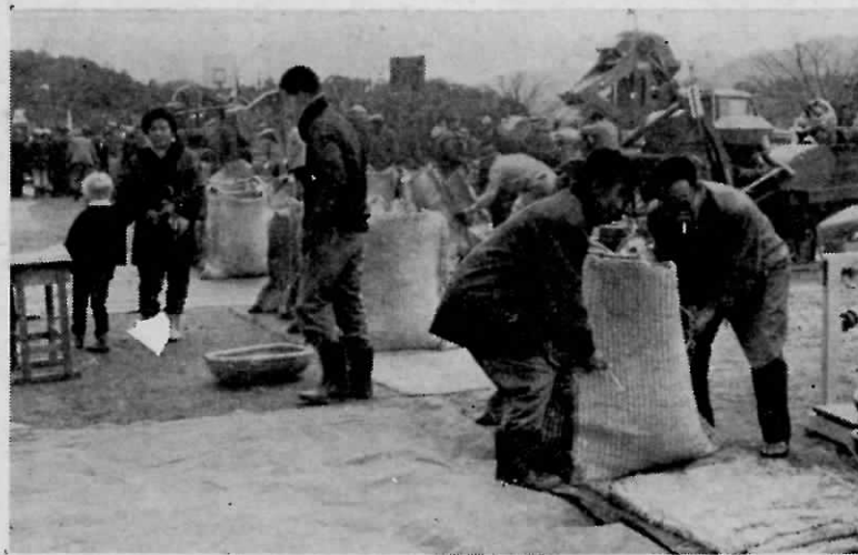
遠賀町農民祭におけるもみすり競技会