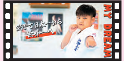
MY DREAM & MY PRIDE シリーズ