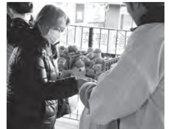
採れたて野菜がたくさん