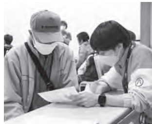
健康測定の結果は……？

町全体で健康と福祉に対する意識を高めることで、誰もがより住みやすい遠賀町にしていきたいですね。