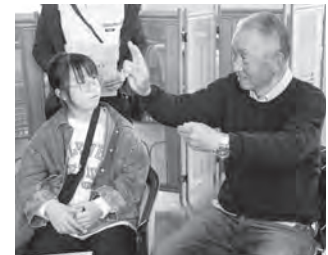
手話で心がつながる