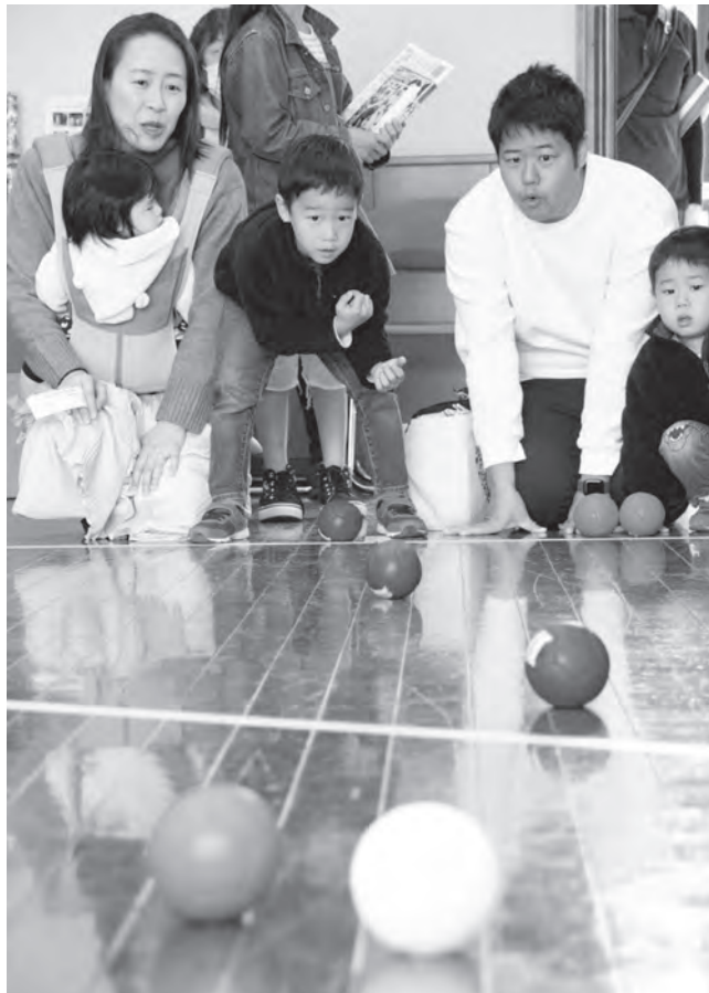
パラスポーツ「ボッチャ」に真剣なまなざし