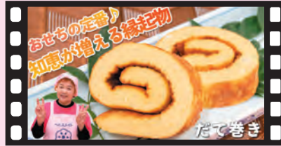
おんがめしシリーズ