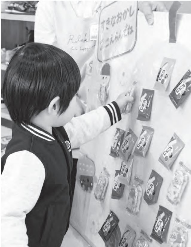
好きなおかしを収穫だぁ♪