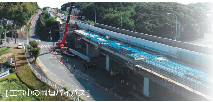
[工事中の岡垣バイパス]