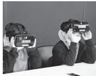
パイロットになった気分！

風が強くて寒い日にも関わらず、会場はたくさんの人でにぎわい、温かい雰囲気に包まれていました。