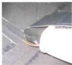
排気ファンスイッチ