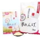
特別栽培米 夢れんげ