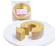
遠賀菜種 パウムクーヘン