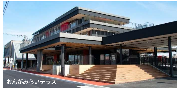
おながみらいテラス