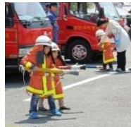
おながこどもまつり