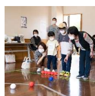
ふれあい福祉フェア