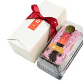
芳香赤しその パウンドケーキ