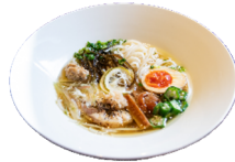
遠賀べいめん (調理例)