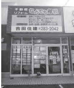
旧3号線沿い茅原信号すぐ側