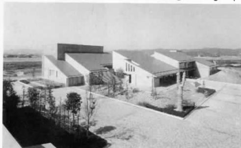
▲コミュニティセンター（上）と遠賀川漕艇場▼