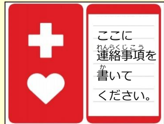
マーク (おもて・うら)

【配布場所】 遠賀町役場 福祉課 障がい者支援係 ※ヘルプマークは県ホームページからも印刷可能